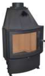
MÝTO R550, LD